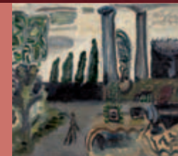
Strawalde (Jürgen Böttcher) Schöneberg mit Gasometer, 1957