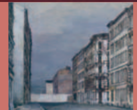
Konrad Knebel Straße mit Mauer, 1977