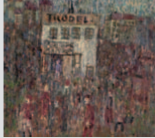
Kurt Mühlhaupt Der alte Trödelladen, 1960

(Material wird kostenfrei zur Verfügung gestellt.)