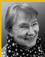
Regina Stürickow © Elsengold Verlag

Alle Lesungen können Sie auch im Livestream verfolgen unter: www.stadtmuseum.de/sommer-im-hof-2021