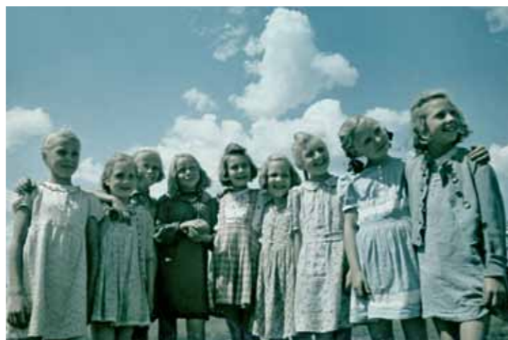
„WALDSCHULE KIDS“, 1946 | Schülerinnen der Waldschule; Charlottenburg, britischer Sektor