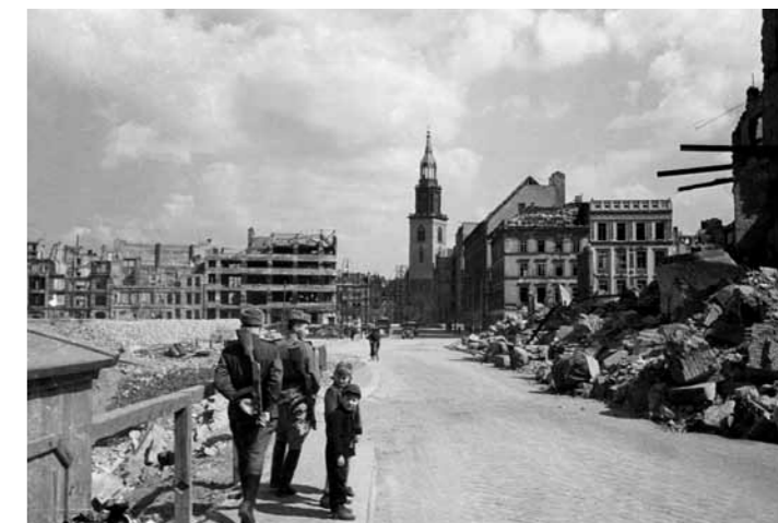
OHNE TITEL, 1945/46 | Blick zur Marienkirche von Südwesten; Mitte, sowjetischer Sektor

The exhibition presents a selection of 150 reprints from Newman's negatives that were housed in Belfast at the Royal Photographic Society after the town and landscape planner returned home. They are complemented by documents and vintage prints as well as the photo albums that Newman put together during his time in Berlin.