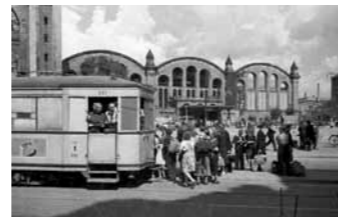
OHNE TITEL, 1946 Straßenbahn am Stettiner Bahnhof, Mitte, sowjetischer Sektor