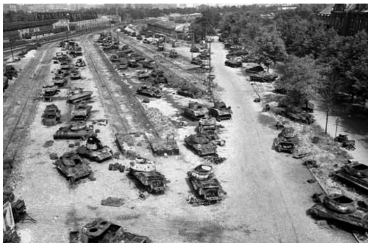
„THE LAST PARADE“, 1946 | „Die letzte Parade“, Panzerwracks auf dem Güterbahnhof Westend; Charlottenburg, britischer Sektor