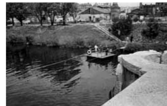
OHNE TITEL, 1946 Fährbetrieb neben der zerstörten March- brücke; Charlottenburg, britischer Sektor

Entry: 3,- / 2,- Euro | Märkisches Museum