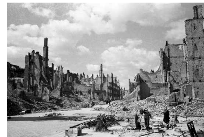
„KLEIN ANDRE STRASSE“, 1946 | Kleine Andreasstraße; Friedrichshain, sowjetischer Sektor