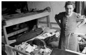
„THREE GENERATIONS“, 1946 „Drei Generationen“, Flüchtlingslager Kruppstraße; Tiergarten, britischer Sektor