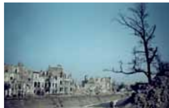
„BERLIN“, 1946 Am Landwehrkanal; vermutlich Tiergarten, britischer Sektor