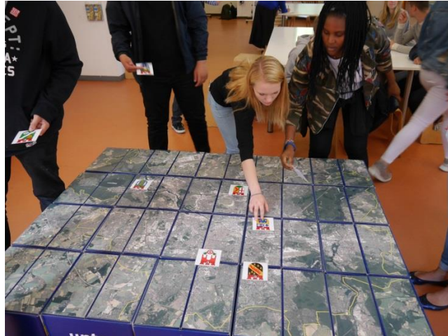
Workshopsituation im Märkischen Museum