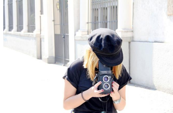
Junior-Kuratoren im Märkischen Museum