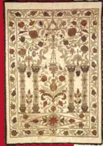
Thoravorhang, osmanisch, 19. Jahrhundert, Atlasseide

Die Hans-und-Luise-Richter-Stiftung bewahrt wesentliche Teile des Nachlasses der Familie Beer-Meyerbeer-Richter. Seit dem 17. Jahrhundert haben die Mitglieder dieser Familie das geistige und wirtschaftliche Leben Berlins nachhaltig geprägt. Ihre Möbel, Gemälde, Grafik, Plastiken, persönliche Erinnerungstücke, Fotoalben, Briefe und andere Archivalien aus über zwei Jahrhunderten zeugen vom Leben und Selbstverständnis deutsch-jüdischen Großbürgertums bis in die Zeit nach dem Zweiten Weltkrieg.