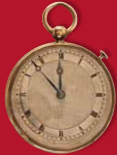
Taschenuhr von Giacomo Meyerbeer. Firma Breguet, Paris 1827